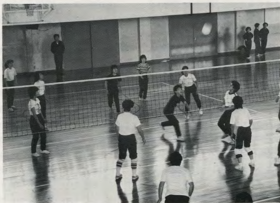
光市医師会体育大会 バレーボール