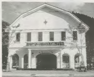
板橋アンティーク・ドール美術館