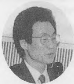
消化器内視鏡検査の進歩