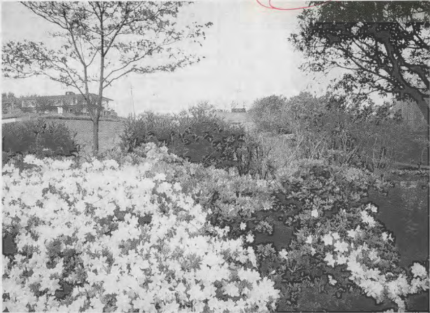
光スポーツ公園 つつじ