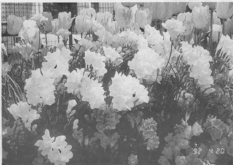
満開のフリージャ

発行所 光市医師会 TEL 0833 72-2234 発行者 福本寿雄 編集者 広報担当 印刷所 光市光井一丁目15番20号 中村印刷株式会社