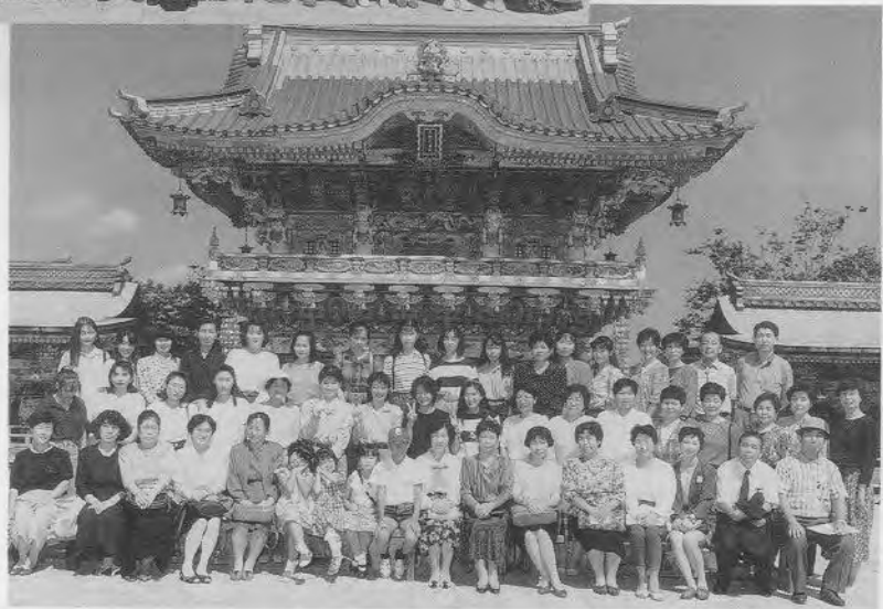
参加人数；会員10名、従業員及び家族104名