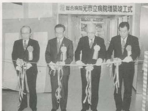
(市立病院よりお借りした写真です)