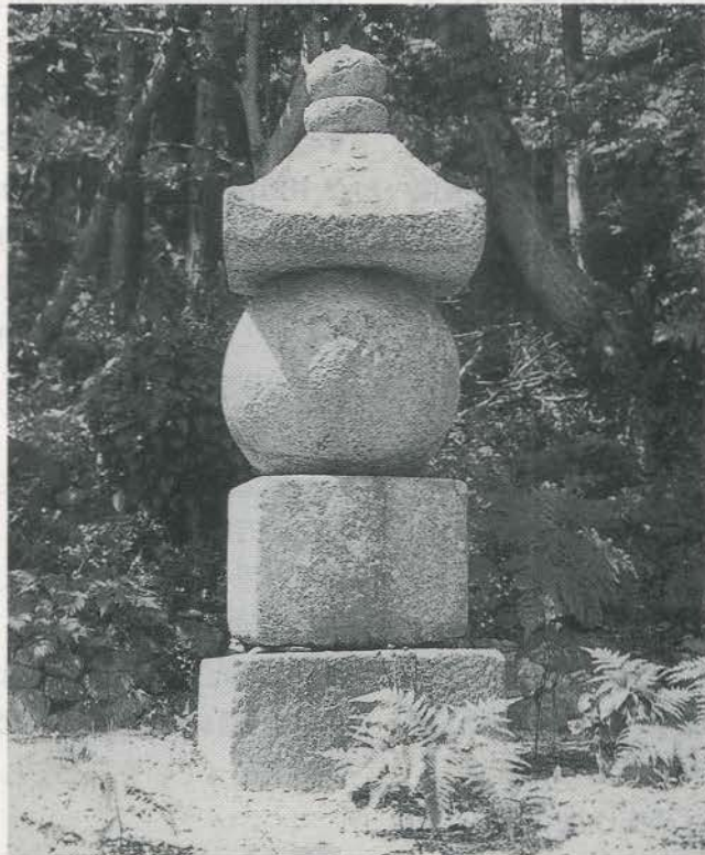
つわものどもが夢のあと (定光寺 宍戸氏五輪塔)