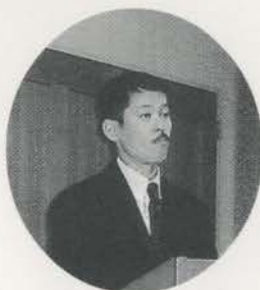
山口大学第1内科 講師