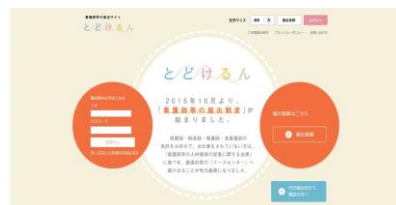
「とどけるん」のトップページ