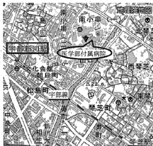
■ JR宇部線宇部新川駅徒歩10分