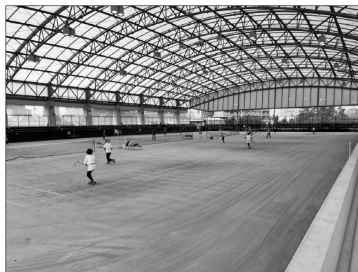
屋内コート試合風景

トレスを感じやすい民族であるから、ダメでもいい、失敗してあたりまえと考え、一旦どん底を受け入れるところから始める思考法がスポーツにおいても合っている」とし、最高のパフォーマンスを引き出せるリラックス方法の紹介など、動画も用いながら面白く解説していただきました。