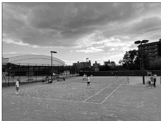
屋外コート試合風景（ミックスダブルス）