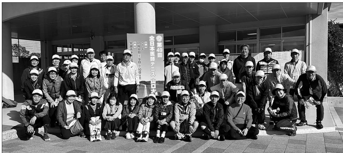
大会役員集合写真