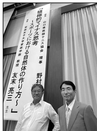
スポーツ予防医学研究会（演者、座長）