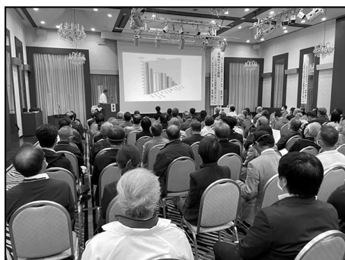
スポーツ予防医学研究会会場風景

次回50回大会は愛媛県松山市内で、51回大会は宮城県仙台市内での開催が予定されています。秋晴れの下、美味しい空気を存分に吸うことができる大会となることを祈っています。