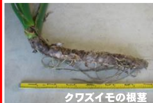
クワズイモの根茎