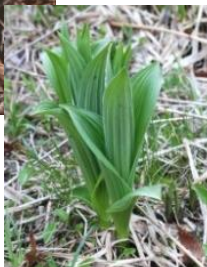
芽出し期のコバイケイソウ