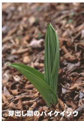
芽出し期のバイケイソウ