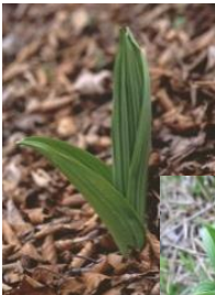
芽出し期のバイケイソウ