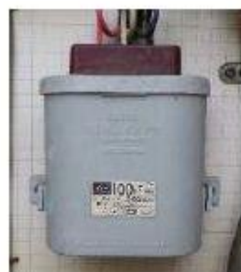
小型コンデンサー